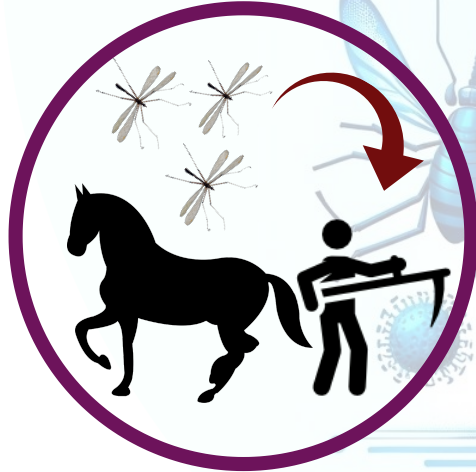
Ciclo epizootico o epidémico

En el ciclo endémico los virus circulan entre los vectores zoofílicos y sus reservorios naturales (aves y roedores) manteniendo una transmisión sostenida.